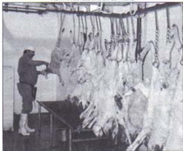
ABATTAGE ILLÉGAL EN ESPAGNE

entré en vigueur en Novembre 1993, la Communauté Européenne est généralement appelée Union Européenne). Cette Directive a d'importantes lacunes, toutefois, elle permet de faire un pas en avant qui est très important. Pour la première fois, les 12 états membres de l'Union Européenne devront adopter dans leur propre législation des règles détaillées sur l'abattage.