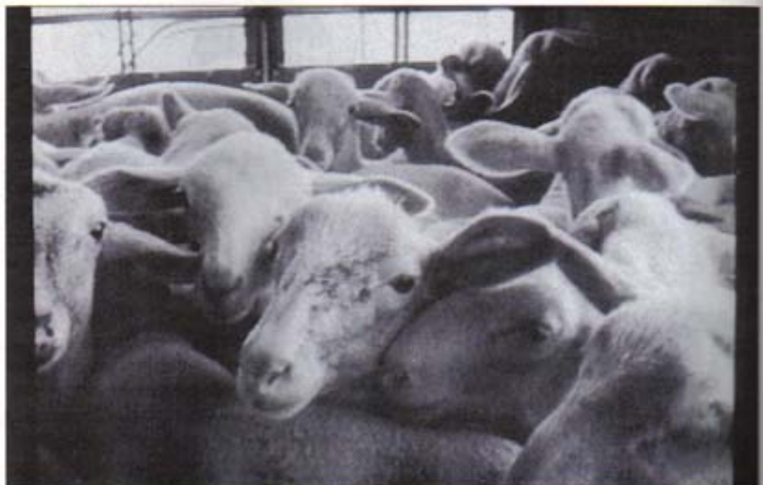
QUELQUES IMAGES DE NOTRE VIDEO

- Des bovins transportés d'Allemagne au Sud de