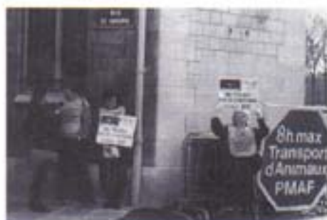
La PMAF devant le ministère de l'agriculture

Nous avons donc dû redoubler d'énergie pour répondre à un afflux de journalistes, tous soucieux de s'enquérir de l'avis de la PMAF. Des journalistes français bien entendu, mais aussi étrangers dans bien des cas. Ainsi, presque tous les grands quotidiens britanniques nous ont interviewés, de même que la BBC Radio et la BBC TV, la télévision allemande et un quotidien national danois.