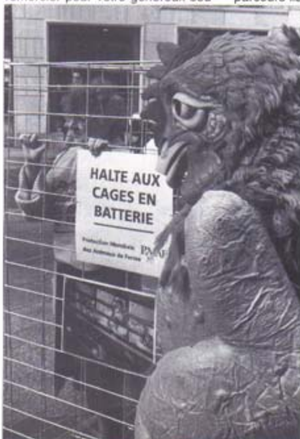
Hetty la poule rencontre les marseillais

Au restaurant, dans les pâtisseries, etc, demandez si les oeufs utilisés proviennent de poules élevées sur parcours libre.