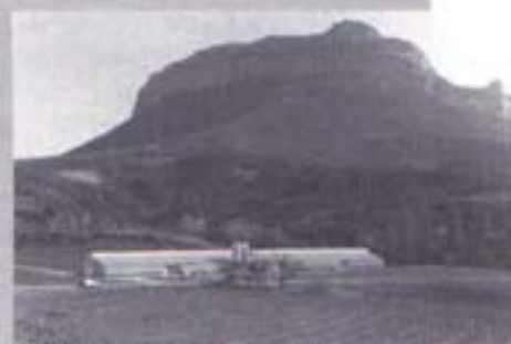
3 000 dindes dans ce lieu concentrationnaire